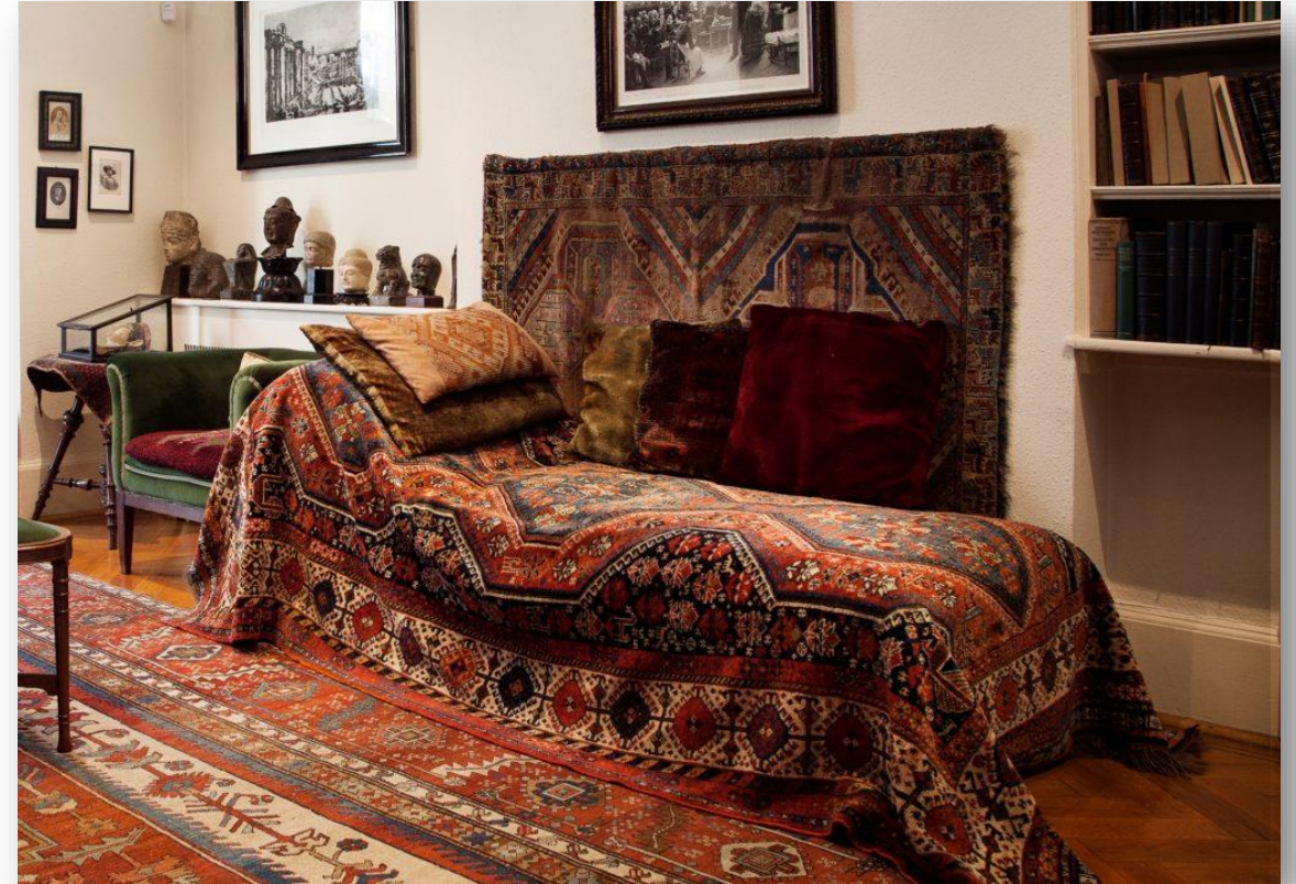
Freud Museum London (o. D.). Sigmund Freud's Famous Psychoanalytic Couch . Abgerufen am 28.06.2024, von Sigmund Freud's Famous Psychoanalytic Couch - Freud Museum London

Was bespreche ich nach dem heutigen Tag mit meiner Coachin bzw. meinem Coach: Was habe ich über Partnerschaft dazugelernt?